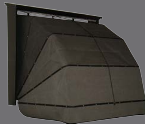
Markies in zwart structuurlak (Ral 9005)