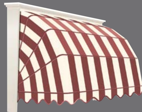
Markies in wit (Ral 9010)